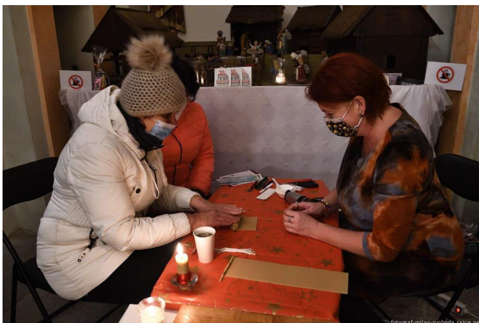
Zapalme svíčku za zemřelé děti, foto M. Svoboda 2020

Děkujeme všem svým členům a poradkyním za podporu našeho spolku včetně jejich terapeutické podpory a doprovázení při truchlení klientů v roce 2020. Ve svém volném čase a bez nároku na odměnu pomáhalo 12 aktivních členů a 4 podporující členi.